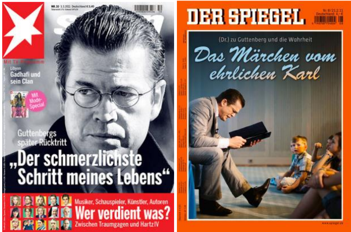
Abbildung 2 Plagiat: Dies muss vermieden werden 19

Wenn fremdes Gedankengut übernommen wird, ist dies im Text durch ein Fußnotenzeichen zu kennzeichnen. Als Fußnotenzeichen sind hochgestellte arabische Ziffern zu verwenden, die nicht in Klammern gesetzt werden. Die erste Fußnote im Text erhält die Ziffer 1, die weiteren Fußnoten werden fortlaufend beziffert. Ist der Inhalt eines vollständigen Satzes aus einer Quelle übernommen, so ist die Fußnotenziffer hinter das den Satz abschließende Satzzeichen zu setzen.